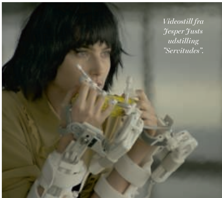
Videostill fra Jesper Justs udstilling "Servitudes".

Følg med i Nicolas Winding Refns nye tv-serie, oplev Jesper Justs udstilling "Servitudes", og se den biografaktuelle film "The Sisters Brothers"